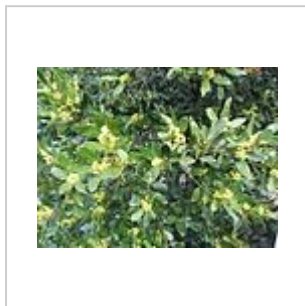
Laurel en flor

baya, ovoide, de 10-15 mm, negra en la madurez, suavemente acuminada con pericarpo delgado. Tiene semilla única de 9 por 6,5 mm, lisa. Madura a principios de otoño.